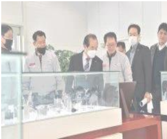
19 ก.พ. เยี่ยมธุรกิจที่ได้รับผลกระทบจากการแพร่ระบาดของโควิด 19