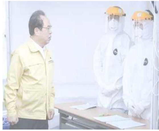
▲ 11 มี.ค. เยี่ยมคลินิกตรวจโรคแบบซับซ้อนในเขตจิน-กู