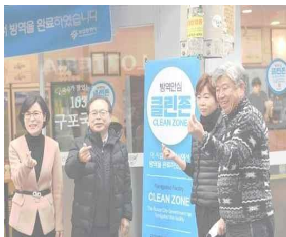
▲ รับรองพื้นที่ปลอดเชื้อ (ร้าน Gupo Gukso 153, ร้าน Gongcha สาขา Dukcheon)