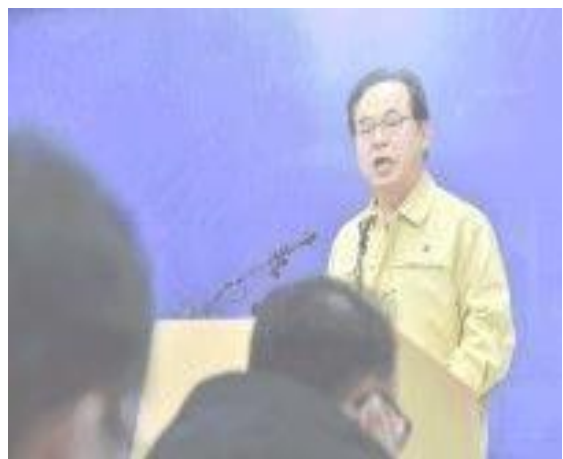
▲ 22 ก.พ. การแถลงสรุปสถานการณ์ต่อสื่อมวลชน