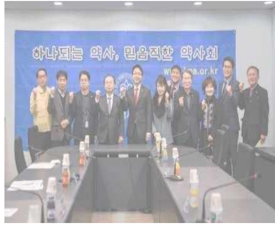
▲ 17 มี.ค. เยี่ยมสมาคมเภสัชกรรมนครปูซาน เพื่อส่งเสริมการขายหน้ากากอนามัยให้แก่สาธารณสุข