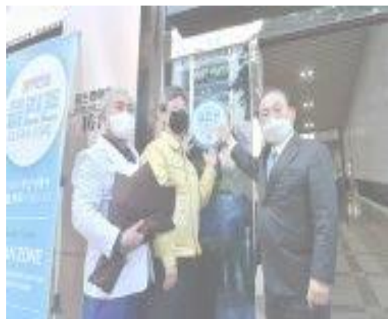
▲ 17 มี.ค. สถานพยาบาลอาเซียต ซึ่งได้รับการปลดสถานะพื้นที่ควบคุมในการกักตัวร่วม