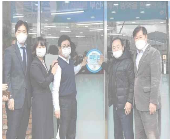
▲ 3 มี.ค. กำหนดพื้นที่ปลอดเชื้อ (ร้านอาหารทงแนมิลมยอน)