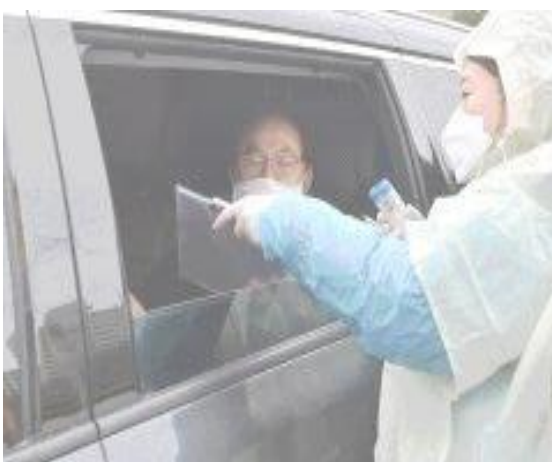
▲ 10 มี.ค. เยี่ยมชมคลินิกตรวจโรคแบบขับผ่านในเขตบัก-กู