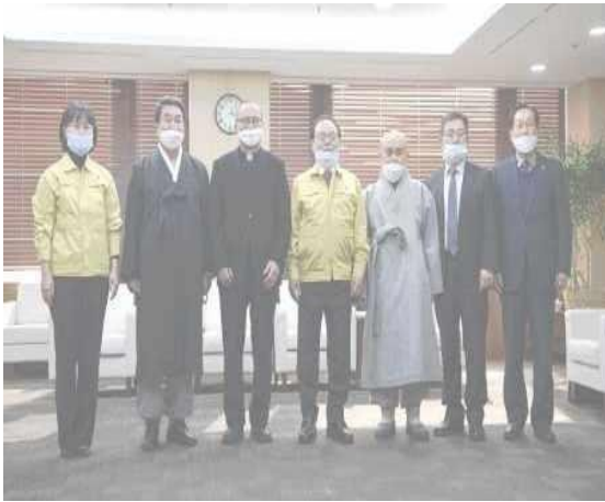
▲ 24 ก.พ. ประชุมร่วมกับผู้นำทางศาสนาจาก 5 ศาสนาหลักเพื่อหยุดการแพร่ระบาดของโควิด 19