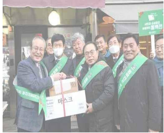
▲ (4 ก.พ.) การนำส่งอุปกรณ์ปลอดเชื้อและการรวบรวมความคิดเห็นที่ตลาดกักเจ