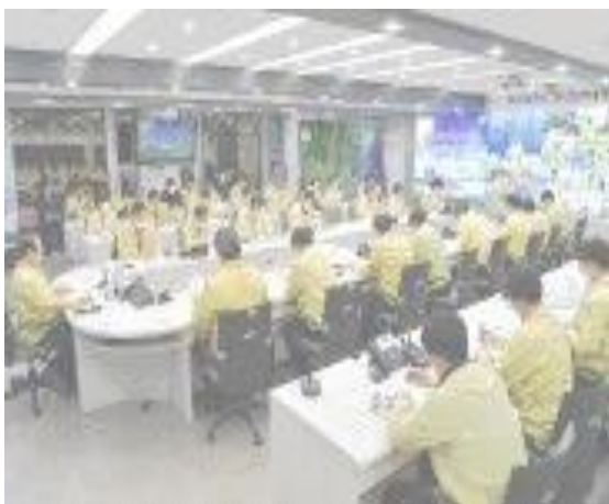
▲ 21 ก.พ. การประชุมเพื่อรับมือต่อสถานการณ์ฉุกเฉินของสถาบันที่เกี่ยวข้องเพื่อรับมือกับผู้ติดเชื้อที่ได้รับการหลังจากมีผู้ติดเชื้อที่ได้รับการยืนยันรายแรก