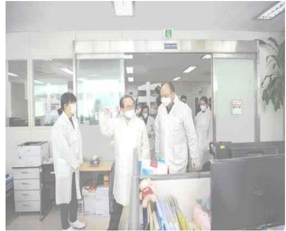
▲ 20 มี.ค. เยี่ยมสถาบันวิจัยสาธารณสุขและ สิ่งแวดล้อมเพื่อลงพื้นที่ตรวจการรับมือการแพร่ระบาด