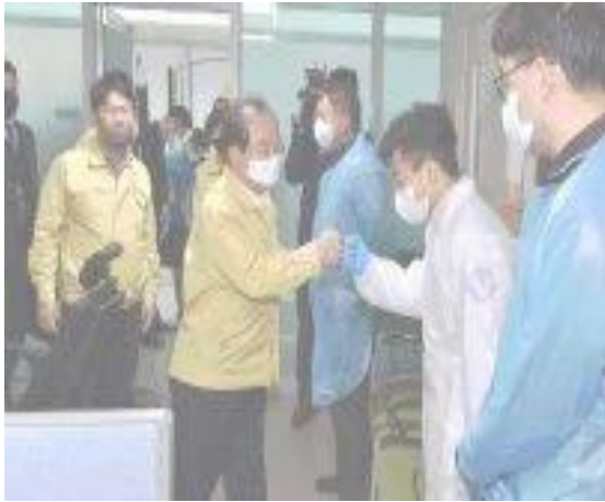
▲ 19 มี.ค. เยี่ยมสถานที่กักตัวชั่วคราวที่ศูนย์พัฒนา ทรัพยากรมนุษย์นครปูซาน