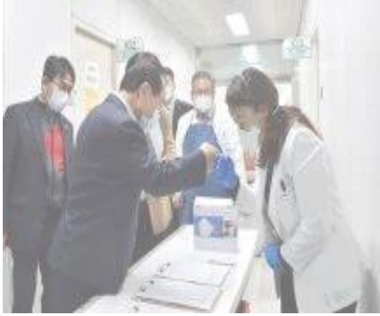
▲ (28 ม.ค.) เยี่ยมศูนย์การแพทย์นครปูซานซึ่งมีการรับมือต่อการแพร่ระบาดของโรคโควิด 19