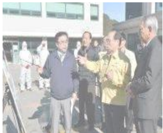
▲ เยี่ยมสมาคมรถแท็กซี่เอกชนเพื่อลงพื้นที่ตรวจการรับมือต่อการแพร่ระบาดของโรค