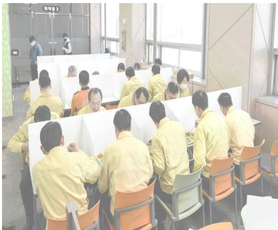
▲ 23 มี.ค. การรับประทานอาหารกลางวัน ณ ศูนย์ อาหารของเมืองเพื่อส่งเสริมการรณรงค์การเว้น ระยะห่างทางสังคม