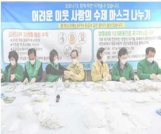
▲ 5 มี.ค. เยี่ยมชมการทำหน้ากากและให้กำลังใจแก่อาสาสมัคร