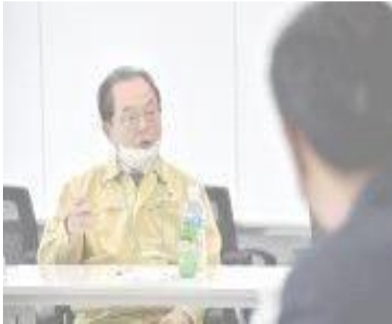
▲ 11 มี.ค. เยี่ยมศูนย์ติดต่อประสานงานบริเวณถนนซอมยอน