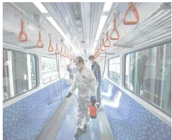
▲ (13 ก.พ.) ลงพื้นที่ตรวจสำนักงานจัดการยานพาหนะโนโปและดำเนินการฆ่าเชื้อ