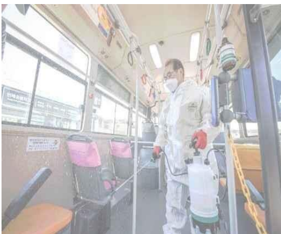
▲ (13 ก.พ.) ลงพื้นที่ตรวจอุ้งรถประจำทางและดำเนินการฆ่าเชื้อ