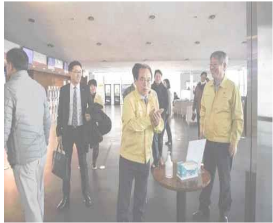
▲ 18 ก.พ. เยี่ยมศูนย์ภาพยนตร์ปูซานเพื่อลงพื้นที่ตรวจการรับมือการแพร่ระบาดของโรค