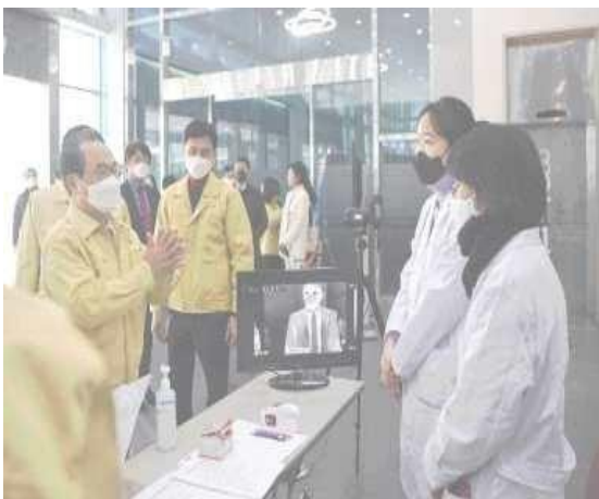
▲ (7 ก.พ.) เยี่ยมศูนย์ประชุมเบกซิคเพื่อลงพื้นที่ตรวจกระบวนการรับมือต่อการแพร่ระบาดของโรคโควิด 19