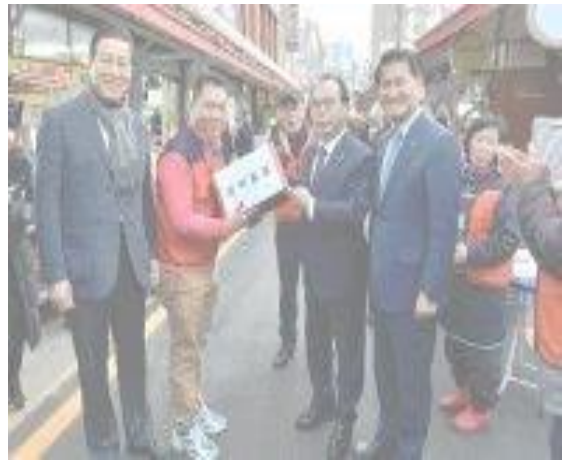
▲ 20 ก.พ. ตลาดชุงจอง - นำส่งอุปกรณ์ปลอดเชื้อและรวบรวมความคิดเห็นจากผู้ค้า