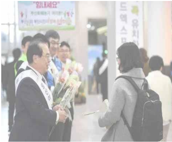
▲ 14 ก.พ. จัดระเบียบตลาดขายดอกไม้เพื่อช่วยเหลือเกษตรกรที่ได้รับผลกระทบ