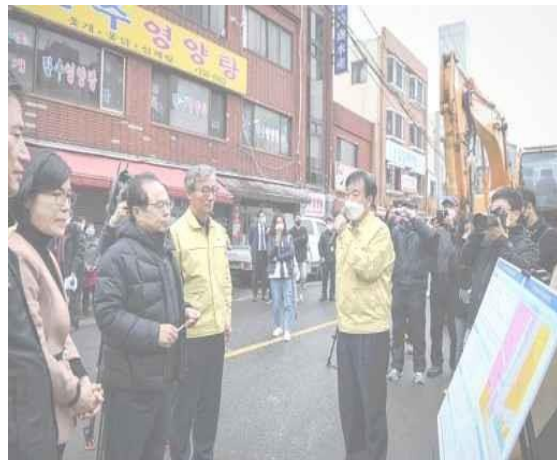
▲ 10 มี.ค. การให้ข้อมูลเกี่ยวกับการปรับปรุงตลาดกูโป